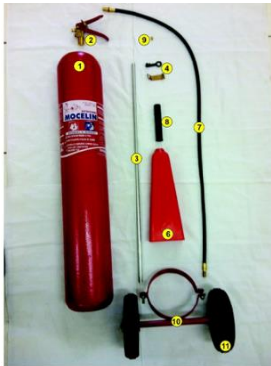
EM10CO Sobre Rodas